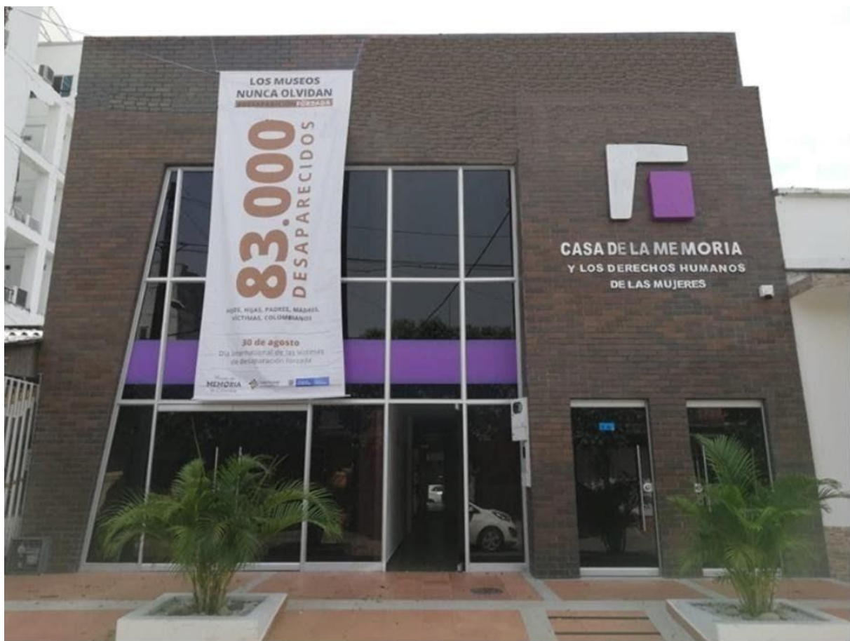
Fachada de la Casa de la Memoria y los DD.HH. de las Mujeres del Magdalena Medio de Colombia, de la Organización Femenina Popular. Inaugurada en el año 2019.

El largo periodo de cooperación de Atelier con Colombia ha proporcionado a nuestra entidad una serie de conocimientos y activos entre los que destacamos: a) La presencia de personal de Atelier - equipo técnico, directivo, socias y colaboradoras - que han viajado a Colombia para prestar apoyo técnico y participar en acciones de diferente alcance y naturaleza como acciones formativas, asistencias técnicas, foros, encuentros, visitas a proyectos en curso, etc.- ha proporcionado a la asociación un conocimiento significativo y vivo del país: marco constitucional, arquitectura institucional, características socioeconómicas y culturales, dinámicas sociopolíticas, etc.