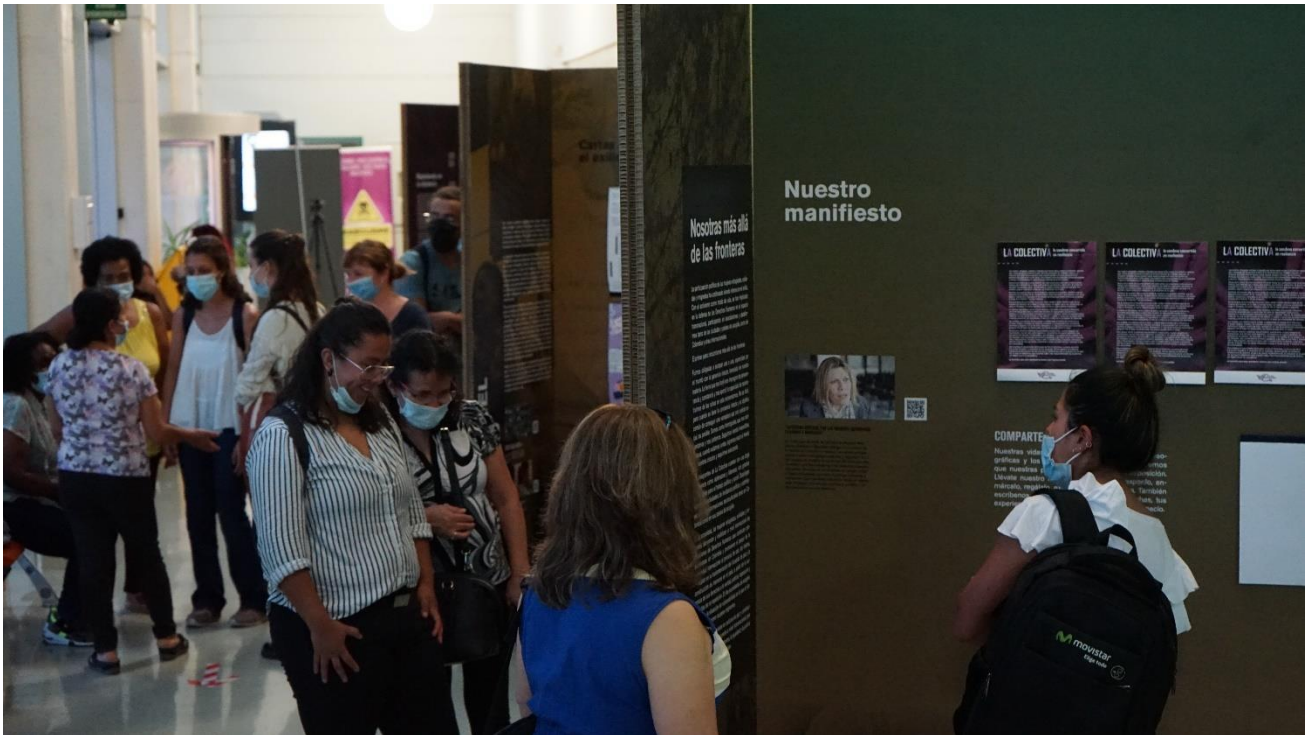
Exposición “Mujeres del exilio. Historias de resiliencia, empoderamiento y transformación” en la Facultad de Ciencias Sociales de la Universidad de València. 2021.