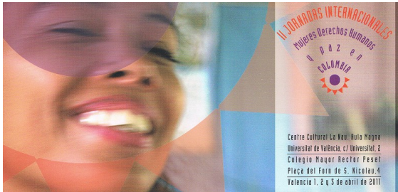
Tríptico de las II Jornadas Internacionales: Mujeres, DDHH y Paz en Colombia.

Durante el año 2011 la Mesa de Apoyo a la Defensa de los DDHH de las mujeres y la Paz en Colombia, cuya Secretaría Técnica es responsabilidad de Atelier, ha realizado en España una campaña continuada de información, sensibilización e incidencia presentando las problemáticas de vulneración de los DDHH de las mujeres en Colombia - como son tierras y desplazamiento forzado, violencia sexual y derechos civiles y de participación política de las organizaciones de mujeres- a diferentes colectivos y asociaciones en varias ciudades, así como a medios de comunicación y a parlamentarios y parlamentarias de España y Colombia. Sin embargo la actividad más significativa durante el año 2011 ha sido la preparación y realización de las II Jornadas Internacionales: Mujeres, Derechos Humanos y Paz en Colombia realizadas en València los días 1,2 y 3 de abril de 2011, que amplían significativamente la relaciones de la Mesa de Apoyo al participar en ellas alrededor de 200 organizaciones de España y Colombia. Las II Jornadas tuvieron una notable incidencia en medios de comunicación con medio centenar de referencias en