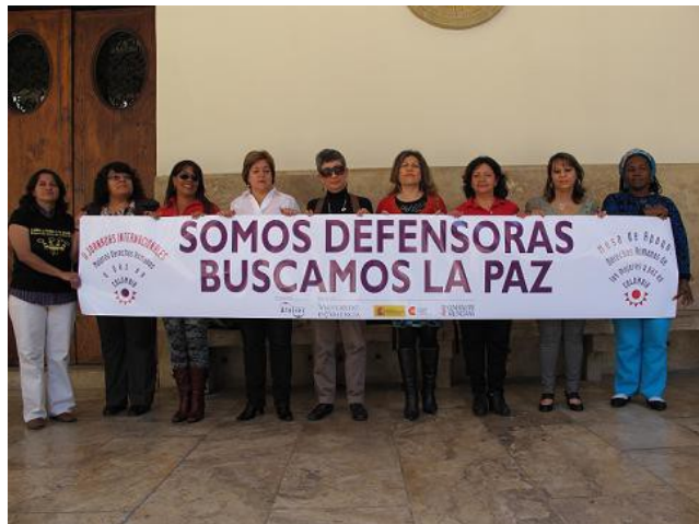
Encuentro de Defensoras de DDHH colombianas, que tuvo lugar en las II Jornadas Internacionales Mujeres, DDHH y Paz en Colombia. Valencia, abril 2011.

A nivel autonómico se han mantenido contactos con representantes políticos en las Corts Valencianes y la Asamblea de Madrid. A todos ellos, Atelier les remitió la propuesta de resolución parlamentaria de la Mesa de Apoyo, así como la publicación de las I Jornadas Internacionales: Mujeres, DDHH y Paz en Colombia, el diagnóstico de situación de mujeres colombianas refugiadas y un resumen de la situación de las mujeres desplazadas.