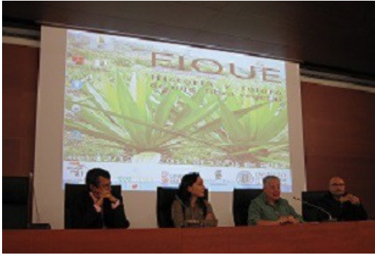
Inauguración de la exposición 'Fique. Historia y futuro de una fibra vegetal' en la Universitat Politècnica de València. Diciembre, 2011.

En febrero de 2012, la muestra se exhibió en la Facultad de Ciencias Sociales de la Universitat de València. Complementariamente, se realizó una jornada de presentación dirigida a estudiantes de la asignatura de Proyectos de dicha Facultad, así como a estudiantes del Master de Desarrollo, Instituciones e Integración Económica y del Master de Economía Social.