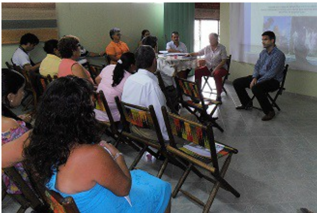
Representantes de ATELIER participan en la Asamblea Anual de Ecofibras. Curití, marzo 2012.

Las poblaciones beneficiarias de los proyectos de cooperación que Atelier ha llevado a cabo son principalmente mujeres de áreas campesinas y urbanas, campesinos y microempresarios. Para ello ha contado con la cofinanciación de la Generalitat Valenciana, Les Corts, Diputación de Valencia, la AECID, varios ayuntamientos de la Comunidad Valenciana y algunas entidades privadas como Caixa Popular y la Fundación Bancaixa.