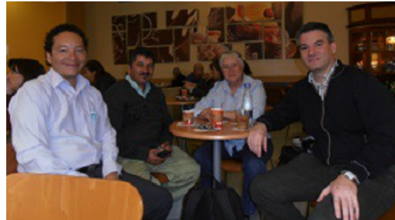
Entrevista con representantes de la Cadena Productiva del Fique. Bogotá, marzo 2012.

Como parte de las ponencias del I Foro se presentó un avance del trabajo de Sistematización de la Experiencia de Ecofibras, incluida su relación de colaboración con Atelier que constituye otra de las actividades significativas del Proyecto Diversifique por cuanto significa un trabajo de reflexión sobre más de diez años de colaboración. Durante el año 2011 se ha llevado a cabo la publicación y edición de 500 ejemplares de las Memorias del I Foro y su distribución en Colombia.