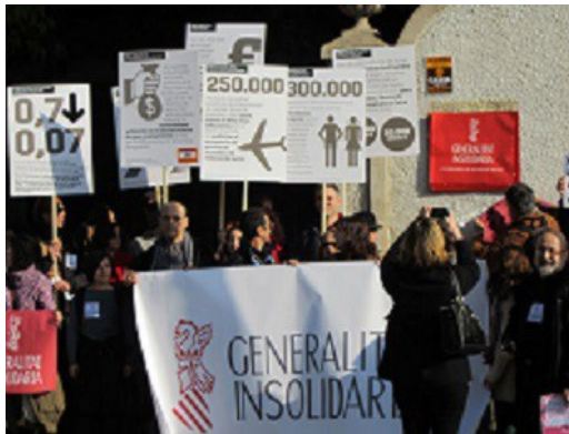
Atelier participó en el acto reivindicativo convocado por la Coordinadora Valenciana de ONGD, reclamando un cambio en las políticas de cooperación de la Generalitat Valenciana. Valencia, diciembre 2012.

Durante los años 2011 y 2012, Atelier ha venido dedicando significativos esfuerzos a la lucha contra la corrupción denunciada en la Conselleria de Solidaritat i Ciutadania al presentar sendos recursos contencioso-administrativos a las resoluciones de las convocatorias de cooperación y de sensibilización del año 2011, que desechaban los proyectos presentados por Atelier.