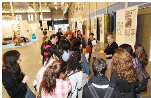
Exposición 'Fique. Historia y futuro de una fibra vegetal' en la Feria de Proyectos solidarios. Valladolid, noviembre 2011.

Posteriormente, en noviembre de 2011, la exposición ' Fique. Historia y futuro de una fibra vegetal ' se presentó en Valladolid en la Feria de Proyectos Solidarios promovida por la AECID y organizada por Feria Valladolid en donde fue visitada por 300 personas. Para finalizar el ciclo de itinerancia de la exposición en 2011, en diciembre y hasta enero de 2012 se ha exhibido en la Escuela Técnica Superior de Ingeniería Agronómica y Medio Natural de la Universidad Politécnica de València, donde — en colaboración con el Centre de Cooperació al Desenvolupament y el Vicerrectorado de Relaciones Internacionales de la Universidad— organizamos tres importantes mesas redondas que abordaron diferentes temas relacionados con el futuro de la fibra y sus posibilidades de