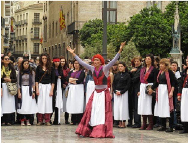
Performance '100 Manuelas por la Paz'. Clausura de las II Jornadas. Valencia, abril 2011. Córdoba.

También ha participado en el Encuentro Internacional de Mujeres y Pueblos contra la Militarización celebrado en agosto en Barrancabermeja (Colombia). Además, asistió a un seminario organizado en noviembre por SISMA, centrado en el análisis de la Resolución 1325 relativa al papel de las mujeres en la búsqueda de la paz. Un actividad formativa sobre esta misma resolución fue impartida por Mujeres en Zona de Conflicto, entidad integrante de la Mesa, en la Cumbre Alternativa de los Pueblos celebrada en Madrid durante el mes de mayo. A su vez, la Mesa de Apoyo dedicó una sesión formativa al análisis del Tribunal Penal Internacional y participó en la reunión en Madrid de Europeos y Europeas por la Paz que contó con la asistencia de la entonces senadora colombiana, Piedad