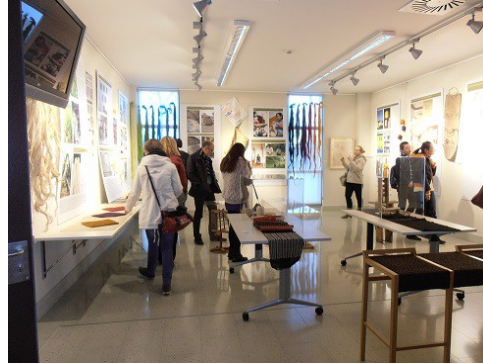
Exposición 'Fique. Historia y futuro de una fibra vegetal' en la Facultat de C. Socials de la Universitat de València. Febrero, 2012.

Tres nuevos productos generados en el contexto del proyecto Diversifique han visto la luz en el año 2011: uno de ellos es la publicación divulgativa ' Fique. Historia y futuro de una fibra vegetal ', otro es la publicación de la sistematización de la experiencia de Ecofibras, trabajo de carácter analítico y el tercero es la nueva colección de bolsas de fique producida por Ecofibras.